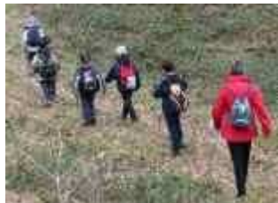
Randonnée avec adulte