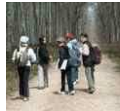
Randonnée en autonomie